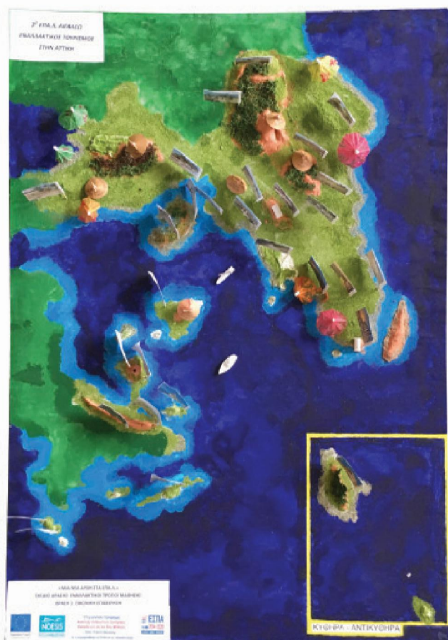
Δράση 1: Εικονική Επιχείρηση: Ίδρυση Γραφείου Εναλλακτικού Τουρισμού.