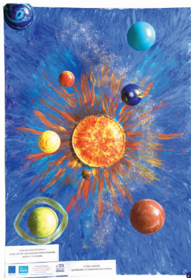
Δράση 2: Το Σύμπαν